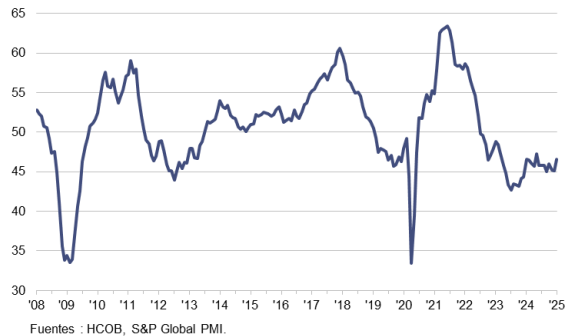
HCOB PMI Sector Manufacturero Zona Euro c.v.e., >50 = mejora desde el mes anterior