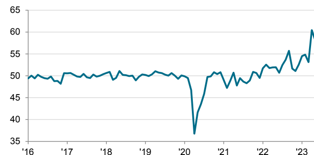
ที่มา: S&P Global PMI เก็บรวบรวมข้อมูลในวันที่ 12-22 มิถุนายน 2023