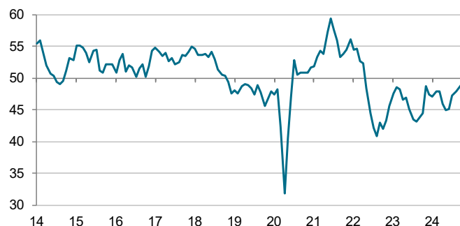
S&P Global PMI sektor przemysłowy wskaźnik sezonowo modyfikowany, > 50 = wzrost m/m

Dane zebrano w dniach 12-25 listopada 2024.