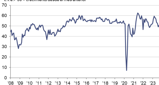
Índice HCOB PMI Actividad Comercial del Sector Servicios c.v.e.> 50 = crecimiento desde el mes anterior