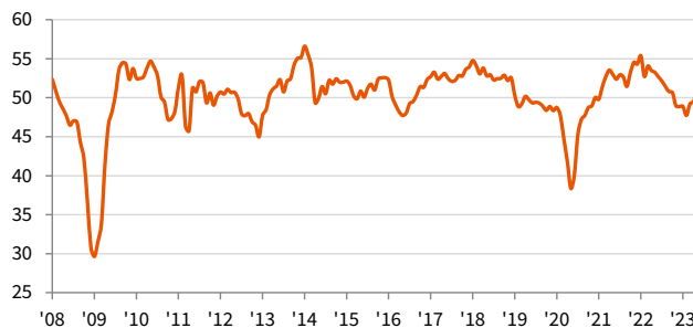
auじぶん銀行日本製造業PMI 季節調整済み、>50 = 前月比で改善