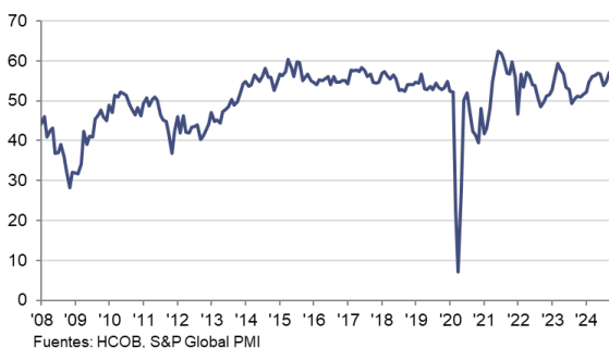
Índice HCOB PMI Actividad Comercial del Sector Servicios c.v.e. > 50 = crecimiento desde el mes anterior