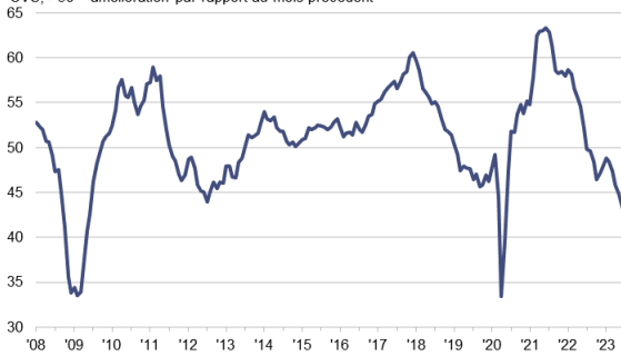
Indice PMI HCOB pour l'industrie manufacturière de la zone euro CVS, >50 = amélioration par rapport au mois précédent