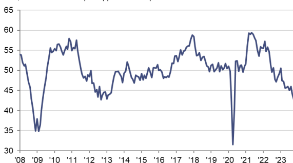
HCOB PMI pour l'industrie manufacturière française cvs. >50 = amélioration par rapport au mois précédent