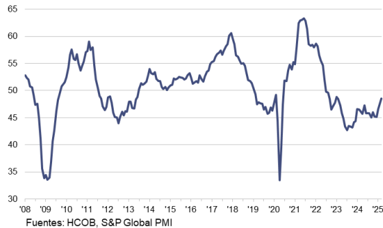
HCOB PMI Sector Manufacturero Zona Euro c.v.e., >50 = mejora desde el mes anterior