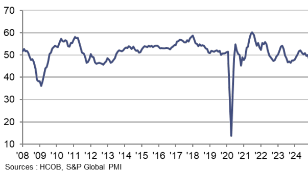
Indice PMI HCOB composite de l'activité globale cvs, >50 = croissance par rapport au mois précédent